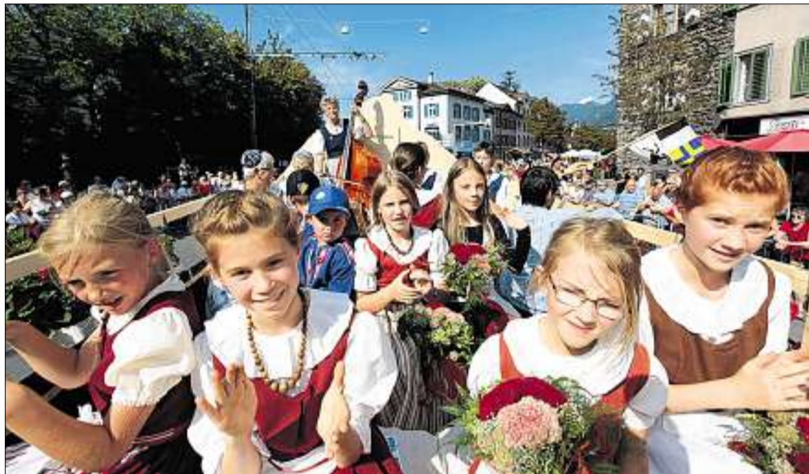
Ungetrübtes Fest: Strahlende Gesichter, musikalische Unterhaltung und stahlblauer Himmel am Eidgenössischen Volksmusikfest in der ältesten Stadt der Schweiz. (Ky)