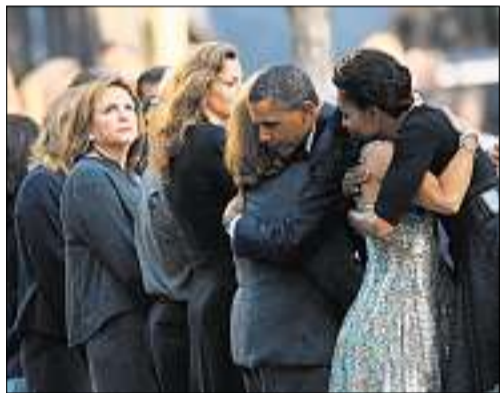
Trauer und Erinnerung an das Unfassbare am Ground Zero in New York. (Ky)

Zehn Jahre nach den Anschlägen vom 11. September 2001 haben die USA mit einer emotionalen Zeremonie am Ground Zero in New York an die fast 3000 Getöteten erinnert. An dem Ort,